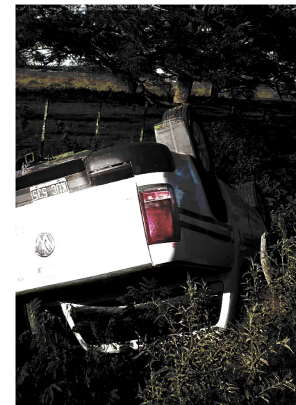
FOTO. Así encontraron la camioneta Amarok blanca que los tres prófugos le habían robado a un ingeniero agrónomo. El vuelco fue sobre la ruta provincial 1, a la altura de la localidad de Campo del Medio. El vehículo fue hallado alrededor de las 3.30 en una cuneta y estaba ploteado con inscripciones de Gendarmería.